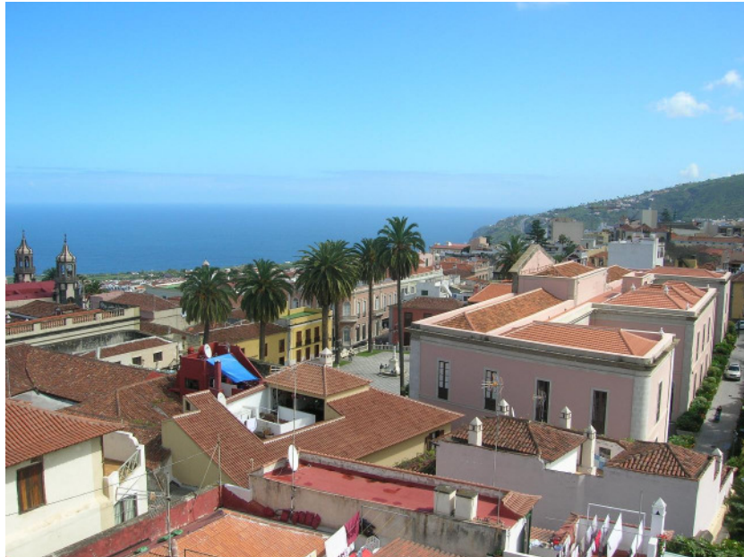
Panorámica del ayuntamiento desde una terraza trasera – La carretera está situada junto a las palmeras