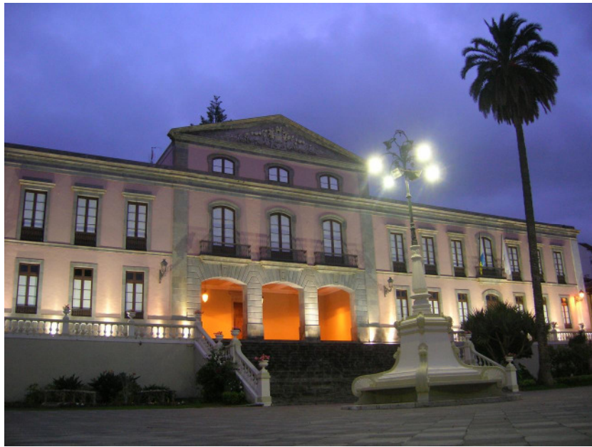
Ayuntamiento de La Orotava ( punto A , punto de encuentro)